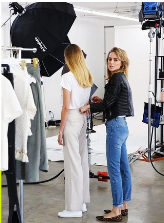
EDITORIAL DE MODA