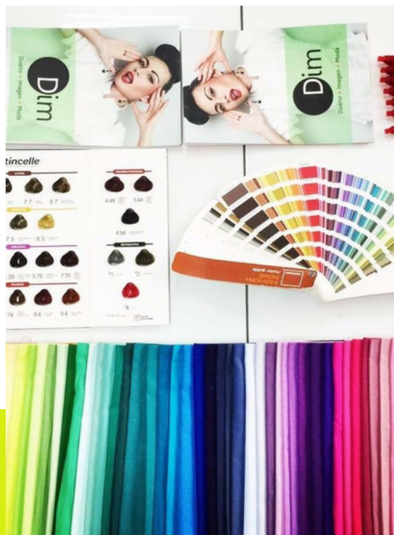
SISTEMA DE COLORIMETRÍA