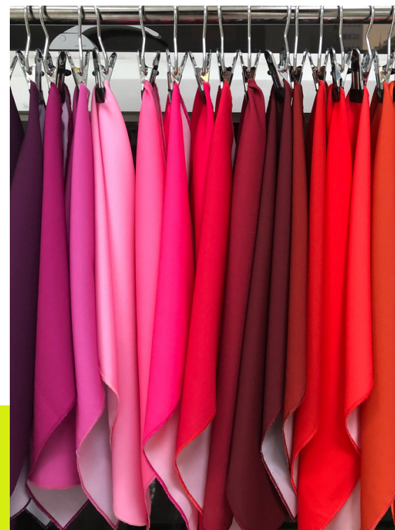
PALETA DE COLOR PERSONAL