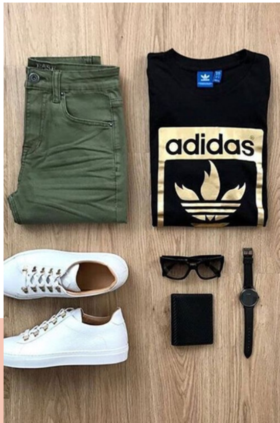
ESTILISMO DE IMAGEN