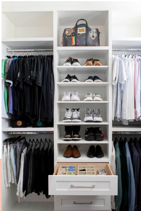
FONDO DE ARMARIO