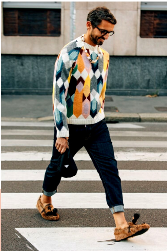
DISEÑO DE IMAGEN PERSONAL